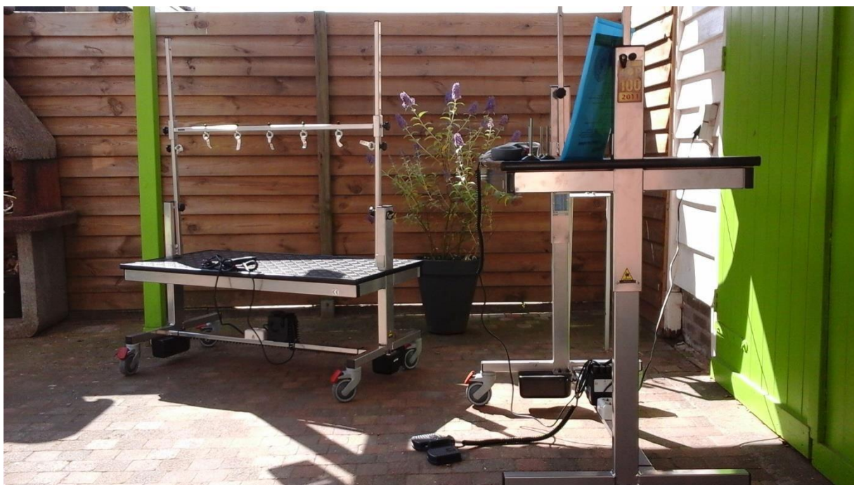
Type op foto: UDS Ergomatic Deluxe trimtafel met trimbeugel